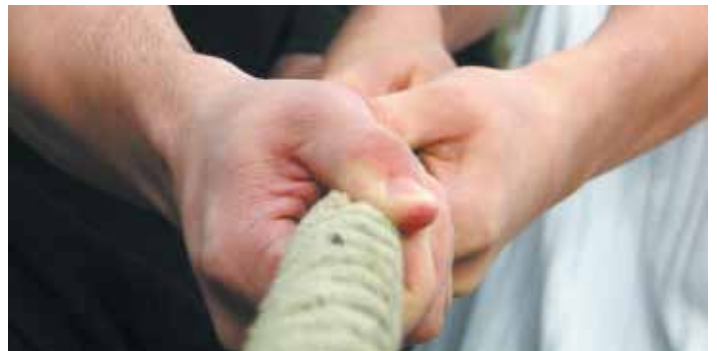
Interessen bündeln: gemeinsam die Kosten senken