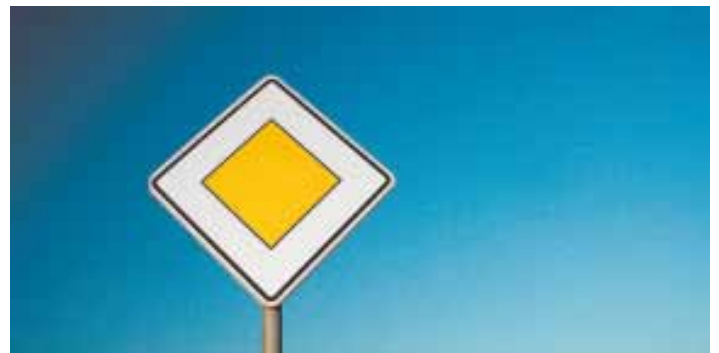
Vorteile nutzen: Outsourcing flexibilisiert Strukturen

Wurde Business Process Outsourcing, kurz BPO, bislang fast ausschließlich von großen Konzernen als innovatives Werkzeug genutzt, erkennen nun auch mehr und mehr Klein- und Mittelständler die Vorteile und rüsten ihr Unternehmen für neue Aufgaben.