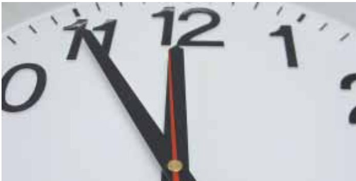
Zeit ist Geld: Handlungsspielräume schaffen, Kosten senken

In Zeiten sich verändernder Markt- und Wettbewerbssituationen müssen alle Räder in Bewegung bleiben, um nicht ins Stocken oder -schlimmer - in einen Abwärtstrend zu geraten. Agieren statt reagieren: hierfür müssen die Unternehmensstrukturen gestrafft und flexibilisiert werden ohne Performance einzubüßen. Investitionsentscheidungen müssen sich auf die Kernkompetenzen konzentrieren, weniger wichtige Unternehmensbereiche können hierfür benötigte Budgets beisteuern.